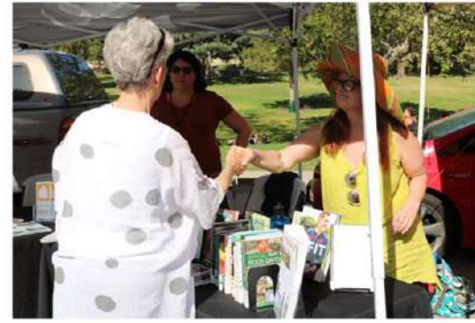
Para la semana de la biblioteca nacional y el día de biblioteca, el personal de la biblioteca lanzó las historias del mercado semanal y se divertía conociendo a los visitantes en el mercado de agricultores y jugando en la mini bici de libros de la biblioteca.

constante en el mercado con un puesto mensual y sesiones de cuenta-cuentos semanales. Todos los miércoles a las 4:00 p.m., nuestro Bibliotecario para Niños será el anfitrión de una sesión de cuenta-cuentos para las familias con bebés, niños pequeños, preescolares y estudiantes de primaria en el césped cerca del Mercado de Agricultores. Luego, el primer miércoles de cada mes, el personal de la Biblioteca estará presente con un puesto en el Mercado para sacar libros, inscribir personas para las tarjetas de la biblioteca y comunicarse con nuestros clientes.